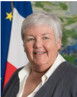
Jacqueline Gourault ministre de la Cohésion des territoires et des Relations avec les collectivités territoriales

Neuf mois après la mise en place de ce fonds, près de 40 millions d'euros ont déjà été attribués à des projets partout en France, dans des collectivités de toute taille. Nous sommes heureuses de cette mobilisation forte des porteurs de projets qui témoigne de leur dynamisme et de leur ambition. Ce sont des projets concrets de simplification des démarches comme l'inscription en crèche ou à la cantine scolaire, des projets de portails en ligne ou encore des projets pour mieux utiliser les données publiques. La méthode du Gouvernement est claire et partenariale : mutualiser les moyens des collectivités et de l'Etat pour co-construire le service public de demain.