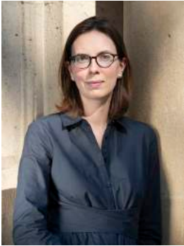
Amélie de Montchalin ministre de la Transformation et de la Fonction publiques

La relance est une occasion inédite de transformer en profondeur notre pays. Nous devons utiliser le numérique pour rendre les services publics plus accessibles et plus simples pour les citoyens, au plus près de leurs usages du quotidien.